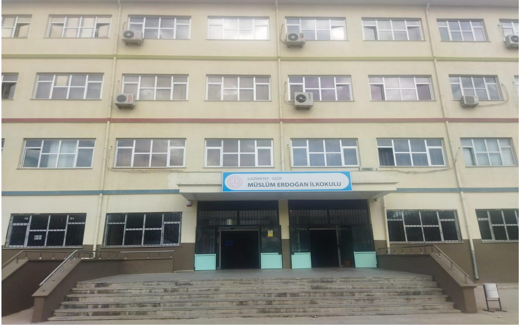
MÜSLÜM ERDOĞAN İLKOKULU